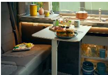
Bild Küche mit Kühlschrank

Die Mietfahrzeuge sind mit einer Grundausstattung Geschirr, Pfannen, Besteck für max. 4 Personen ausgestattet (Nachfolgende Bilder zeigen den VW T6 Ocean mit Küche)