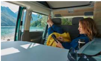
Der geräumige Innenraum